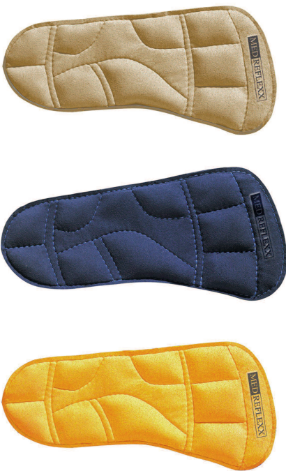
2 Die Therapiesohle (Fotos: Medreflex).

rung verstanden werden, im Sinne einer abgestuften Regelung von Hemmung und Erregung. In Abhängigkeit der jeweiligen Belastungssituation können die Golgi-Sehnen-Organen jedoch auch fördernd auf die Arbeitsmuskeln wirken.